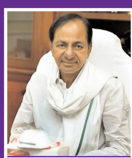
సీఎం కేసీఆర్ శ్రద్ధాంజలి ఘడించారు. హైదరాబాద్ లాంటి కాంక్రీట్ కారణాల్లో కూడా ఊహించనంత పచ్చదనం పెరగడంతో అంతర్జాతీయ ఉద్యోగిని సంఘం అందించే వరల్డ్ గ్రీన్ సీట్ అవార్డ్- 2022 హైదరాబాద్ కు దక్కిందన్నారు. అభివృద్ధి ఎంత సాధించినా, సాంకేతిక పరిజ్ఞానం ఎంత పెరిగినా ప్రకృతి పరిరక్షణ మన ప్రాథమిక ధ్యేయమని స్పష్టం చేశారు. పర్యావరణ పరంగా తగిన రక్షణ చర్యలు చేపట్టని ఫలితమే గోబల్ వార్మింగ్ రూపంలో చూస్తున్నామని వెల్లడించారు. అందుకే మనతోపాటు, భవిష్యత్ తరాలు కూడా ఈ పుడమిపై జీవించే హక్కును కాపాడుతున్న బాధ్యత మనందరిపైనా ఉందన్నారు. ఈ దిశగా అటవీ శాఖ చేస్తున్న ప్రయత్నాలు ప్రశంసనీయమని చెప్పారు. పారిశుధ్యం కోసం మన లక్షిత పచ్చదనం 33 శాతం సాధించేదాకా కలిసికట్టుగా పనిచేద్దామని ముఖ్యమంత్రి ఈ సందర్భంగా పిలుపునిచ్చారు. ఇదే సమయంలో అటవీ రక్షణ కోసం కార్యదీక్షతో పనిచేసిన అధికారులు, సిబ్బంది 22 మంది విడి నిర్వహణలో ప్రాణాలు కోల్పోయారని, వారి ఆతిథ్యం మనందరికీ సూర్య దాయకమన్నారు. అదవుల రక్షణ కోసం ఆత్మార్పణం చేసిన అమరులకు హృదయ పూర్వక శ్రద్ధాంజలి ఘడించారు. వారి ఆశయాలు సజీవంగా ఉండాలంటే ప్రభుత్వం అమలు చేస్తున్న 'ఇంగ్లెట్ బచావో-జంగల్ బచావో' నిరాదాని చిత్తశుద్ధితో మనం అమలు చేయాలన్నారు. సమాజంలోని ప్రతి ఒక్కరూ ఆ దిశగా ప్రతిష్ట తీసుకోవాలని ముఖ్యమంత్రి సూచించారు.