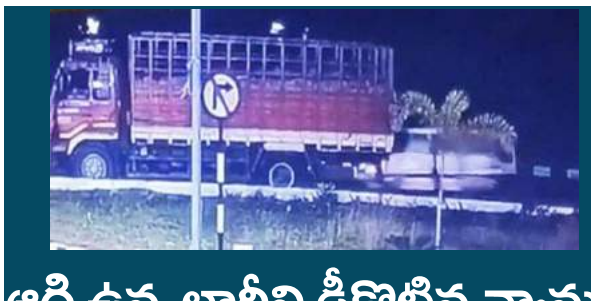
ఆగి ఉన్న లారీని ఢీకొట్టిన వ్యాను

• పరుగులు తీసిన ప్రయాణికులు వరుస రైలు టీ మీడియా, సెప్టెంబర్ 6, హుబ్లీ : ప్రమాదాలు ఆందోళనకు గురి చేస్తున్నాయి. ఇటీవల పట్టాలు తప్పడం, రైల్వేలో పాగలు రావడం వంటి ఘటనలతో కలవరానికి గురి చేస్తున్నాయి. తాజాగా మహబూబ్ నగర్ జిల్లాలో రైలులో పాగలు వచ్చాయి. వరుస రైలు ప్రమాదాలు ఆందోళనకు గురి చేస్తున్నాయి. ఇటీవల పట్టాలు తప్పడం, రైల్వేలో పాగలు రావడం వంటి ఘటనలతో కలవరానికి గురి చేస్తున్నాయి. తాజాగా మహబూబ్ నగర్ జిల్లాలో రైలులో పాగలు వచ్చాయి. హైదరాబాద్ నుంచి చౌరా వెళ్తున్న ఈస్ట్ కోస్ట్ ఎక్స్ ప్రెస్ లో పాగలు రావడంతో రైలును నిలిపివేశారు. బళ్ళారికి రైలు నుంచి పాగలు రావడంతో ప్రయాణికులు పరుగులు పెట్టారు. అయితే, బ్రేక్ లైన్ పట్టేయడంతో పాగలు వచ్చినట్లుగా నిబ్బంది పెట్టారు. ఆ తర్వాత రైల్వే సిబ్బంది సంఘటనా చేరుకొని మరమ్మతులు చేశారు. దాదాపు అరగంట తర్వాత రైలు మళ్లీ బయలుదేరడంతో అంతా ఊపిరిపిల్చుకున్నారు.