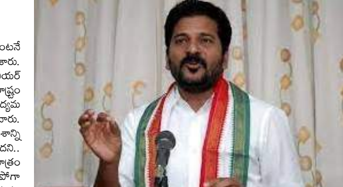
సకాలంలో జీతాలు లేక వందలాది మంది అవస్థలు పడుతున్నారు. నెలల తరబడి జీతాలు రాక కుటుంబాలను

టీ మీడియా, సెప్టెంబర్ 6, హైదరాబాద్ : తెలంగాణలో కాంట్రాక్టు జూనియర్ లెక్కరర్ల వేతనాలు వెంటనే చెల్లించాలని టిపీసీసీ అధ్యక్షుడు రేవంత్ రెడ్డి డిమాండ్ చేశారు. రాష్ట్ర సాధన ఉద్యమంలోనూ కాంట్రాక్టు ఉద్యోగులు, జూనియర్ లెక్కరర్లు కీలక భూమిక పోషించారన్నారు. ప్రత్యేక రాష్ట్రం రాగానే ఓక్క సంవత్సరం అందరినీ రెగ్యులర్ చేస్తా అని ఉద్యమ సమయంలో కేసీఆర్ ఇచ్చిన హామీ ఏమైందని ప్రశ్నించారు. 2014 తెలంగాణ రాష్ట్ర సమితి మేనేజింగ్ నూ ఈ అంశాన్ని చేర్చినట్లు చెప్పారు. ఆశించినట్లే తెలంగాణ రాష్ట్రం వచ్చిందని.. అయినప్పటికీ కాంట్రాక్టు జూనియర్ లెక్కరర్లను మాత్రం రెగ్యులర్ చేయలేదన్నారు. ప్రమబద్ధి కరణ జరగకపోగా జీతాలివ్వడం అర్థించాల్సిన పరిస్థితి వచ్చిందని అసహనం వ్యక్తం చేశారు. ఈ మేరకు సీఎం కేసీఆర్ కు రేవంత్ రెడ్డి బహిరంగ లేఖ రాశారు. "విధులను సక్రమంగా నిర్వహిస్తున్నా