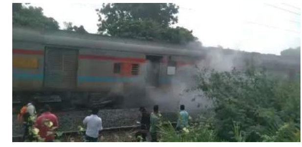
ఈస్ట్ కోస్ట్ ఎక్స్ ప్రెస్ రైలులో పాగలు