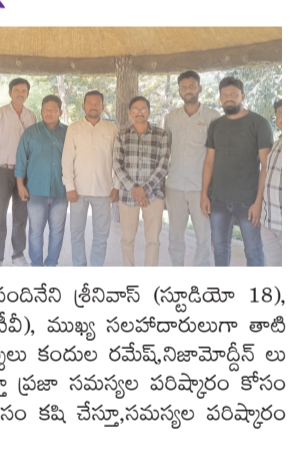
సెటిలైట్ కింద డిస్కన్ కార్మికులకు ఒక అవకాశం కల్పిస్తామని అని మళ్ళీ ఢిల్లీ, సింగరేణి డిస్కన్ కార్మికులను ఢిల్లీకి తీసుకువచ్చింది. 2 సంవత్సరాలలో పరుసగా 100 మాస్టర్లు అనే లిటికేషన్ పెట్టి 95% మంది సమస్యయేలా సర్దుబాటు చేసినందుకు సత్కారం చేసింది. ఇట్టి విషయంలో ఎంపికీ న్యాయం జరగలేదు. ఎలాంటి షరతులు లేకుండా, వన్ టైం సెటిలైట్ కింద డిస్కన్ కార్మికులకు అవకాశం కల్పించాలని కోరుకుంటున్నాము. ఇట్టి విషయంలో ఢిల్లీకి తీసుకువచ్చిన ఈ సర్దుబాటు పట్ల మాకు చావు తప్ప ఇంకా దాని కనిపించడం లేదు అని తెలియజేస్తున్నాం. అన్ని యూనియన్ సంఘాలు చొరవ తీసుకొని, యాజమాన్యం తో చర్చలు జరిపి షరతులు లేని సర్దుబాటు నీ తీసుకురావాలని డిస్కన్ కార్మికులు తరఫున కోరుకుంటున్నాం. మమ్మల్నే నమ్మకొని బ్రతుకుతున్న మా కుటుంబాలకు అన్ని యూనియన్ల సంఘాల ద్వారా న్యాయం జరుగుతుంది అని ఆశిస్తున్నామని అన్నారు. ఈ సమావేశంలో పలువురు డిస్కన్ కార్మికులు పాల్గొన్నారు.