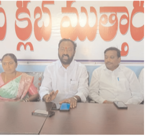
సెటిలైట్ కింద డిస్కన్ కార్మికులకు ఒక అవకాశం కల్పిస్తామని అని మళ్ళీ ఢిల్లీ, సింగరేణి డిస్కన్ కార్మికులను ఢిల్లీకి తీసుకువచ్చింది. 2 సంవత్సరాలలో పరుసగా 100 మాస్టర్లు అనే లిటికేషన్ పెట్టి 95% మంది సమస్యయేలా సర్దుబాటు చేసినందుకు సత్కారం చేసింది. ఇట్టి విషయంలో ఎంపికీ న్యాయం జరగలేదు. ఎలాంటి షరతులు లేకుండా, వన్ టైం సెటిలైట్ కింద డిస్కన్ కార్మికులకు అవకాశం కల్పించాలని కోరుకుంటున్నాము. ఇట్టి విషయంలో ఢిల్లీకి తీసుకువచ్చిన ఈ సర్దుబాటు పట్ల మాకు చావు తప్ప ఇంకా దాని కనిపించడం లేదు అని తెలియజేస్తున్నాం. అన్ని యూనియన్ సంఘాలు చొరవ తీసుకొని, యాజమాన్యం తో చర్చలు జరిపి షరతులు లేని సర్దుబాటు నీ తీసుకురావాలని డిస్కన్ కార్మికులు తరఫున కోరుకుంటున్నాం. మమ్మల్నే నమ్మకొని బ్రతుకుతున్న మా కుటుంబాలకు అన్ని యూనియన్ల సంఘాల ద్వారా న్యాయం జరుగుతుంది అని ఆశిస్తున్నామని అన్నారు. ఈ సమావేశంలో పలువురు డిస్కన్ కార్మికులు పాల్గొన్నారు.