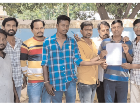
సెటిలైట్ కింద డిస్కన్ కార్మికులకు ఒక అవకాశం కల్పిస్తామని అని మళ్ళీ ఢిల్లీ, సింగరేణి డిస్కన్ కార్మికులను ఢిల్లీకి తీసుకువచ్చింది. 2 సంవత్సరాలలో పరుసగా 100 మాస్టర్లు అనే లిటికేషన్ పెట్టి 95% మంది సమస్యయేలా సర్దుబాటు చేసినందుకు సత్కారం చేసింది. ఇట్టి విషయంలో ఎంపికీ న్యాయం జరగలేదు. ఎలాంటి షరతులు లేకుండా, వన్ టైం సెటిలైట్ కింద డిస్కన్ కార్మికులకు అవకాశం కల్పించాలని కోరుకుంటున్నాము. ఇట్టి విషయంలో ఢిల్లీకి తీసుకువచ్చిన ఈ సర్దుబాటు పట్ల మాకు చావు తప్ప ఇంకా దాని కనిపించడం లేదు అని తెలియజేస్తున్నాం. అన్ని యూనియన్ సంఘాలు చొరవ తీసుకొని, యాజమాన్యం తో చర్చలు జరిపి షరతులు లేని సర్దుబాటు నీ తీసుకురావాలని డిస్కన్ కార్మికులు తరఫున కోరుకుంటున్నాం. మమ్మల్నే నమ్మకొని బ్రతుకుతున్న మా కుటుంబాలకు అన్ని యూనియన్ల సంఘాల ద్వారా న్యాయం జరుగుతుంది అని ఆశిస్తున్నామని అన్నారు. ఈ సమావేశంలో పలువురు డిస్కన్ కార్మికులు పాల్గొన్నారు.

● డిస్కన్ కార్మికుల ఆవేదన టీ మీడియా, అక్టోబర్ 6, గోదావరిపాటి : గోదావరిపాటి జవహర్ నగర్ లోని సింగరేణి స్టేషియంలో శుక్రవారం 2019 నుండి 2022 వరకు డిస్కన్ అయిన రామగుండం ఏరియా ఆర్టి 1 ఆర్టి 2, ఆర్టి 3, శ్రీరాంపూర్ ఏరియా, మండపల్లి కార్మికులు సమావేశం నిర్వహించారు. ఈ సందర్భంగా వారు మాట్లాడుతూ.. 2019-2022 డిస్కన్ కార్మికుల సర్దుబాటు వలన తీవ్ర అన్యాయం జరిగిందని కార్మికుల పక్షాన పోరాటాలు చేస్తున్న హెచ్ఎంఎస్, బిఎస్ఐఎస్, ఏబిఐఎస్, సిబిఐఎస్, బిఎంఎస్, యూనియన్ సంఘాల నాయకులు మాకు న్యాయం చేయాలని ఆవేదన వ్యక్తం చేశారు. మొదటి నుండి ఎలాంటి షరతులు లేని,%తీ%వన టైం