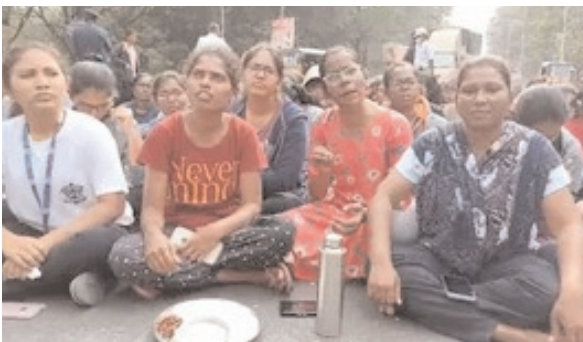
నెల నుంచి లేడీస్ హాస్టల్లో ఉంటున్నానని, వాదిన నూనెను మళ్లీ మళ్లీ వాడుతున్నారని తెలిపారు. మూడు, నాలుగు సార్లు పాలిష్ చేసిన

టీ మీడియా, జనవరి 9, హైదరాబాద్: ఉస్మానియా యూనివర్సిటీ లేడీస్ హాస్టల్ ముందు విద్యార్థినులు ధర్మా చేపట్టారు. మధ్యాహ్నం భోజనంలో పురుగులు వచ్చాయంటూ రోడ్డుపై బైరాముంది నిరసన తెలిపారు. గత కొన్ని రోజులుగా భోజనం సరిగా లేక ఇబ్బందుల పాలవుతున్నాయన్నారు. పురుగుల అన్నం తిని ఆరోగ్యంగా ఉండలేకపోతున్నామని, నాణ్యమైన ఆహారం అందించాలని డిమాండ్ చేస్తున్నారు. బీఫ్ వార్మెను తొలగించి స్ట్రెస్ సౌకర్యాలు కల్పించాలని విద్యార్థినులు డిమాండ్ చేస్తున్నారు. గతంలోనే సమస్యలు పరిష్కరించాలని విన్నవించినా పట్టించుకోలేదని ఆవేదన వ్యక్తం చేశారు. ఓయూ లేడీస్ హాస్టల్ డైరెక్టర్ రాజీనామా చేయాలని డిమాండ్ చేస్తున్నారు. ఇప్పటికైనా అధికారులు స్పందించి సమస్యలు పరిష్కరించాలని, లేదంటే ఆందోళనలు ఉధృతం చేస్తామని హెచ్చరించారు. ఓ విద్యార్థిని మీడియాతో మాట్లాడుతూ.. మూడు