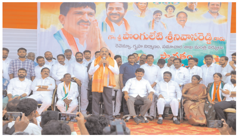
పది లక్షల ఎకరాలకు సాగు నీరు ఇవ్వడం కాంగ్రెస్ లక్ష్యమన్నారు. తన జీవిత కాలంలో చివరి కోరిక ఇదేనన్నారు. నిన్న ప్రాజెక్ట్ కు సంబంధించిన సీట్ల కోసం నిధులు కేటాయించామని తెలిపారు. టన్నెల్ పూర్తి కాగానే పాలేరుకు నీళ్లు వస్తాయని మంత్రి చెప్పారు. పాలేరుకు నీళ్లు వచ్చేలా తాము పొంగలేటితో కలిసి ఇద్దరం చేస్తామన్నారు. పాలేరు ఖమ్మం తమ దృష్టిలో ఒక్కటేనని తెలిపారు. తాము జీవితాంతం రుణపడి ఉంటామని మంత్రి తుమ్మల పేర్కొన్నారు.

టీ మీడియా, జనవరి 10,కూసుమంచి (ఖమ్మం) : సంక్రాంతి పండుగ అయిపోగానే రైతులందరికీ రైతుబంధు అందుతుందని మంత్రి తుమ్మల తెలిపారు. ఖమ్మం జిల్లా కూసుమంచిలో మంత్రి పొంగలేటి కార్యాలయంలో మీడియాతో మాట్లాడుతూ, రైతుబంధును అపోహలు వద్దని కోరారు. తమ ప్రభుత్వంలో నిజమైన అర్హులకు పథకాలు అందిస్తే తమ లక్ష్యం సెరవేరుతుందని తెలిపారు. కాగా.. అనాటి సీఎం కేసీఆర్.. మాటలకే పరిమితం అయ్యారని విమర్శించారు. కానీ.. ఈనాటి సీఎం రేవంత్ ద్వారా ప్రజల వద్దకు పథకాలు వెళుతున్నాయని తెలిపారు. రేవంత్ రెడ్డి శ్రమ సత్కెన్ కావాలని ఆయన కోరారు. ఖమ్మం జిల్లా ముగ్గురు మంత్రులం ఈ జిల్లా కోసం పాలేరుకు సీతారామ ప్రాజెక్ట్ జలాలు వచ్చేలా చూస్తామమన్నారు. ఇది ఇలా ఉంటే ఎంత అహంకారం ఉన్నా.. ప్రజల ముందు దిగదుడుపే అని తెలంగాణ ప్రజలు నిరూపించారన్నారు. తెలంగాణలో కబ్బాల రాజ్యం పోవాలని ప్రజలు కోరుకున్నారని.. అందుకే కాంగ్రెస్ ప్రభుత్వం ఏర్పడిందన్నారు. ఖమ్మం జిల్లాకు ఈ ఏడాదిలోనే నీరు ప్రవేశిస్తాయని మంత్రి తుమ్మల నాగేశ్వరరావు పేర్కొన్నారు.