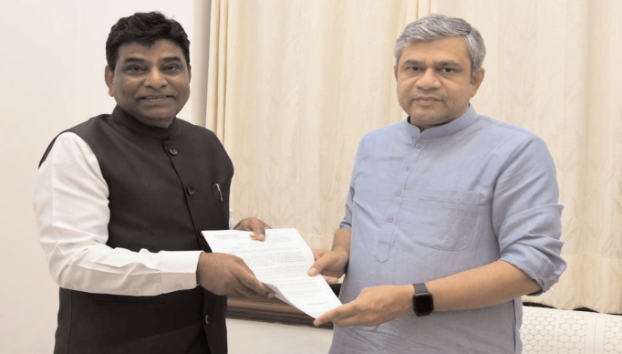
శాతవాహన ఎక్స్ ప్రెస్ నిలుపుదల చేయడం పల్ల యాత్రికులకు , దూర ప్రాంత భక్తులకు ఎంతో ఉపశమనం కలుగుతుందని నామ నాగేశ్వరరావు పేర్కొన్నారు.

-శేర్ల రైల్వే మంత్రి కఠిన మళ్లీ లేఖ అందజేసిన ఎంపీ నామ టీ మీడియా, జనవరి 3, ఖమ్మం : చారిత్రక ప్రసిద్ధ జమలాపురం వెంకటేశ్వర స్వామి పుణ్యక్షేత్రాన్ని పరిగణలోకి తీసుకొని ఎర్రపాలెం రైల్వే స్టేషన్ లో శాతవాహన ఎక్స్ ప్రెస్ రైలును కొద్దిసేపు నిలుపుదల చేయాలని టిఆర్ఎస్ లోక్ సభా పక్ష నేత, ఖమ్మం పార్లమెంట్ సభ్యులు నామ నాగేశ్వరరావు బుధవారం ఢిల్లీలో రైల్వే మంత్రి అశ్వినీ వైష్ణవ్ కు కలిసి ఈ మేరకు లేఖ అందజేశారు. తక్షణమే స్పందించి చర్యలు తీసుకోని, ప్రజలకు , యాత్రికులకు తేలు చేయాలని కోరారు. తాను ప్రాతినిధ్యం వహిస్తున్న ఖమ్మం పార్లమెంటరీ నియోజకవర్గం పరిధిలోని డోర్నకల్ - విజయవాడ మార్గంలో ఎర్రపాలెం రైల్వే స్టేషన్ ఉందని, ఎర్రపాలెం మండల పరిధిలోని జమలాపురంలో వెంకటేశ్వర స్వామి చారిత్రక దేవాలయంలో శ్రీ వేంకటేశ్వర స్వామి వారు కొలువై ఉన్నారని, దీనిని తెలంగాణా చిన్న తిరుపతిగా కూడా మీలుస్తారని అన్నారు. ఈ చారిత్రక పుణ్యక్షేత్రానికి ప్రతి ఏడాది 10 నెలల 15 లక్షల మంది భక్తులు , యాత్రికులు దూర ప్రాంతాల నుంచి వచ్చి స్వామి వారిని దర్శించుకుంటారని ఎంపీ