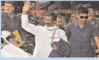
హేమంత్ సోరెన్ కోర్టులో హాజరుపరిచింది.

టీ వీడియో, ఫిబ్రవరి 7, రాంఠి : జార్ఖండ్ మాజీ ముఖ్యమంత్రి హేమంత్ సోరెన్ కన్నడీని ప్రత్యేక పిఎంఎల్ఎ కోర్టు బదులొకటిగా పాడిగింపించింది. ఈనెల 2వ తేదీన పిఎంఎల్ఎ కోర్టు విధించిన ఐదు రోజుల ఎవర్సైడ్ మెంట్ డైరెక్టరీట్ (ఇడి) కన్నడీ బుధవారం కోర్టు సమీపంలో ముగిసింది. డింకో మరో ఐదురోజుల పాటు కన్నడీని కోర్టు పాడిగింపించు బుధవారం న్యాయవాదులు తెలిపారు. భూకుంభకోణానికి సంబంధించిన మనీలాండ్ రిగ్ మేన్ సోరెన్ ను ఇడి ఏడుగుంటల పాటు సుదీర్ఘ విచారణ అనంతరం గత బుధవారం రాత్రి అరెస్ట్ చేసిన నంగలి తెలిసింది. అరెస్టుకు ముందు ఆయన సిఎం పదవికి రాజీనామా చేశారు. గురువారం ఉదయం సోరెన్ ను భారీ భద్రతాదళాల మధ్య రాంచీలోని సివిల్ కోర్టులో హాజరుపరిచింది.