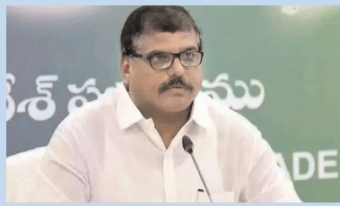
మంత్రి బొత్తు సత్యనారాయణ విడుదల చేశారు.

టీ వీడియో, ఫిబ్రవరి 7, అమరావతి : ఆంధ్రప్రదేశ్ ప్రభుత్వం డీఎస్సీ నోటిఫికేషన్ ను విడుదల చేసింది. ఈ మేరకు సచివాలయంలో 6,100 ఉపాధ్యాయ నియామక నోటిఫికేషన్లను రాష్ట్ర విద్యాశాఖ మంత్రి బొత్తు సత్యనారాయణ విడుదల చేశారు. 2,280 ఎస్జీటీ పోస్టులు , 2,299 సాధారణ అసిస్టెంట్ పోస్టులు , 1,264 డిజిటీ పోస్టులు, 215 వీజీటీ పోస్టులు, 242 డ్రాస్ట్రీట్ పోస్టుల భర్తీకి ప్రభుత్వం నిర్ణయం తీసుకుంది.