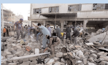
పాకిస్థాన్ లో గురువారం జరిగిన పేలుడు సంఘటనల వల్ల మరణించిన వారి కుటుంబాలను సత్కరించారు.

-22 మంది మృతి టీ వీడియో, ఫిబ్రవరి 7, ఇస్లామాబాద్: రాజకీయ, ఆర్థిక సంక్షోభంలో ఉన్న పాకిస్థాన్ లో గురువారం ఎన్నికలు జరుగుతున్నాయి. అయితే పాకిస్థాన్ కు ముందు రోజు పేలుడు సంఘటనలు జరిగాయి. పాకిస్థాన్ అభ్యుదయ పార్టీకి చెందిన పాకిస్థాన్ జనతా పార్టీ అధ్యక్షుడు ఎన్నికల కార్యాలయాల సమీపంలో జరిగిన పేలుళ్లలో 22 మంది మరణించారు. వైరుతి ప్రావిన్స్ బలూచిస్థాన్ లో బుధవారం ఈ సంఘటన జరిగింది. షిషన్ జిల్లాలో స్వతంత్ర అభ్యర్థి కార్యాలయం వద్ద మొదటి పేలుడు జరిగింది. ఈ సంఘటనలో 12 మంది మృత్యుులయ్యారు. వరుస సంఖ్యలో గాయపడ్డారు. కాగా, అబ్దుల్ హక్ సరిహద్దుకు సమీపంలో ఉన్న ఖిల్లా ప్రాంతంలో రెండవ దాడి జరిగింది. జమీయత్ ఉలేమా ఇస్లాం (జేయూఐ) కార్యాలయం సమీపంలో పేలుళ్లు సంభవించాయి. ఈ దాడుల వెనుక ఎవరన్నారన్నది స్పష్టం కాలేదు. అయితే ఉగ్రవాదులు, బహుచిస్థాన్ వేర్పాటు వాదులు ఈ పేలుళ్లకు పాల్పడి ఉండవచ్చని అనుమానిస్తున్నారు. మాజీ ప్రధాని ఇఫ్రాన్ ఖాన్ అరెస్ట్ నేపథ్యంలో రాజకీయ, ఆర్థిక సంక్షోభంలో ఉన్న పాకిస్థాన్ లో గురువారం జాతీయ ఎన్నికలు జరుగుతున్నాయి. ఈ పేలుళ్ల నేపథ్యంలో భారీగా భద్రతా ఏర్పాట్లు చేశారు.