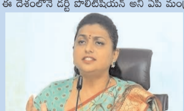
మంత్రి ఆర్కే రోజా మాట్లాడుతూ..

టీ వీడియో, ఫిబ్రవరి 7, విజయవాడ : చంద్రబాబు ఆర్కే రోజా మండిపడ్డారు. ఆమె విజయవాడలో బుధవారం మీడియాతో మాట్లాడుతూ.. ప్రధాని మోడీ తల్లి, భార్యని తిట్టిన వ్యక్తి చంద్రబాబు. మోడీని తిట్టి, సబ్ జెండ్రాలు ఎగురవేశారు. మళ్లీ ఇప్పుడు మోడీ కాళ్ళు పట్టుకోవడానికి సిద్ధపడ్డారు. మోడీని దేశంలో లేకుండా చేస్తానని చంద్రబాబు గతంలో అన్నాడు. అమిత్ షాపై తిరుగుబాటు చంద్రబాబు రాష్ట్ర వేయించాడు. ఇప్పుడు అమిత్ షా కాళ్ళు పట్టుకుంటున్నారు. చంద్రబాబు జైల్లో ఉన్నప్పుడు కాళ్ళు పట్టుకోవడానికి తన కొడుకు లోకేశ్ ను పంపాడు. ఇప్పుడు చంద్రబాబుతో కలిసి బీజేపీకి నష్టం అని రోజా దుయ్యబల్టారు. ఇక వచ్చే ఎన్నికల్లో ఎన్ని పార్టీలు కలిసినా వైఎస్ జగన్.. మళ్లీ ముఖ్యమంత్రి అవుతారని మంత్రి రోజా ధీమా వ్యక్తం చేశారు.