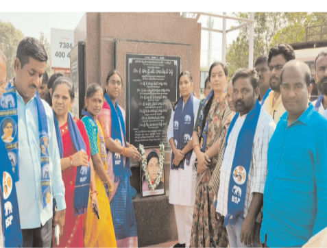
అంబేద్కర్ సామాజిక న్యాయం సమావేశం కోసం పోరాడుతున్నప్పుడు ఆయనకు అందగా నిలిచిన ఆదర్శ మహిళా మాత రమాబాయి అని, ఆదర్శ మహిళా త్యాగానికి ప్రతీకగా అంబేద్కర్ అని పేరు తెచ్చుకున్నామని అన్నారు.