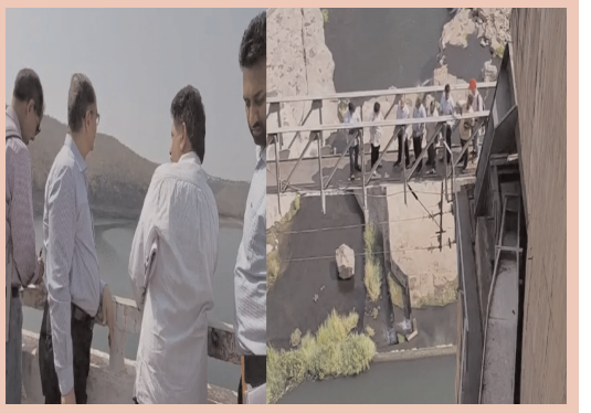
శ్రీశైలం డ్యామ్ ని సందర్శించిన ఎన్టీఎస్ఐ, కేఆర్ఎంబి సభ్యుల బృందం..