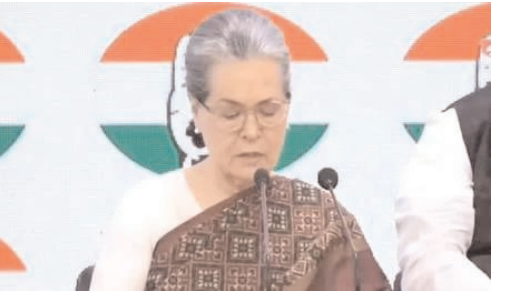
బలవంతంగా దోచుకుంటున్నారు" అని అన్నారు. అయినప్పటికీ.. ఆత్మతం సవాళ్లతో కూడిన పరిస్థితుల్లో కూడా,

టీ మీడియా, మార్చి 21, న్యూఢిల్లీ: ఎన్నికల ముందు తమ పార్టీని ఆర్థికంగా కుంగదీసేందుకు మోడీ ప్రభుత్వం క్రమబద్ధంగా యత్నిస్తోందని కాంగ్రెస్ అధ్యక్షురాలు సోనియాగాంధీ మండిపడ్డారు. గురువారం న్యూఢిల్లీలో సోనియాగాంధీ, రాహుల్ గాంధీలు ప్రత్యేక మీడియా సమావేశం నిర్వహించారు. ప్రధాన ప్రతిపక్ష పార్టీ ఆర్థిక పరిస్థితిపై దాడి ఆమోదయోగ్యం కాదని, అప్రజాస్వామికమని మండిపడ్డారు. "ఈరోజు మనం ఎదుర్కొంటున్న సమస్య చాలా తీవ్రమైనది. ఈ చర్యలు కేవలం కాంగ్రెస్ పార్టీపైనే కాదు, ప్రజాస్వామ్యంపైనే ప్రభావం చూపుతోంది. కాంగ్రెస్ పార్టీని ఆర్థికంగా కుంగదీయడానికి ప్రధాని మోడీ క్రమబద్ధమైన చర్యలు చేపడుతున్నారు. ప్రజల నుండి తమ పార్టీ సేకరించిన నిధులను స్తంభింప చేస్తున్నారు. మా ఖాతాల నుండి సగదును