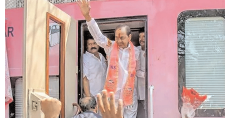
మోడల్ కోడ్ ఆఫ్ కండక్ట్ కింద ఎన్నికల నిబంధనలను ఉల్లంఘించినందుకు ఈ చర్యలు తీసుకుంటున్నట్లు ఈసీ స్పష్టం చేసింది.