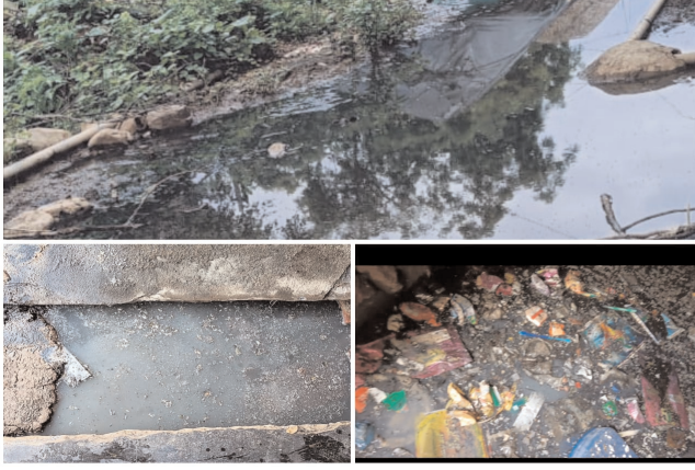
సాగి విధంగా లేకపోవడంతో తీవ్ర ఇబ్బందుల పరిస్థితులు ఏర్పడ్డాయి. ఈ మురుగునీరు నిలిచిపోవడంతో, దోమలు అవాసం చేసుకుని వృద్ధి చెందుతున్నాయని, వీటివల్ల ఆరోగ్యాన్ని దృష్టిలో ఉంచుకుని, డ్రైనేజీ మురుగునీరు ముందుకు సాగి విధంగా చర్యలు చేపట్టాలని కోరుతున్నారు.

అనారోగ్యం బారిన పడాల్సి వస్తుందని, ఇళ్ల ముందు నుంచి వెళ్తున్న కాలువలో పారుదల లేక, డ్రైనేజీ మురుగునీరు దుర్గంధం వెదజల్లుతుందని స్థానికులు ఆవేదన వ్యక్తం చేస్తున్నారు. అధికారులకు ఎన్ని పర్యాయాలు తెలిపిన నిమ్మకు నీరెత్తినట్లు ఉన్నారని వాపోతున్నారు. ప్రజల ఆరోగ్యాన్ని దృష్టిలో ఉంచుకుని, డ్రైనేజీ మురుగునీరు పారుదల ముందుకు సాగి విధంగా చేపట్టాలన్నారు. అలాగే గాజులపల్లె గ్రామంలోని ఎస్సీ కాలనీ 8వ వార్డు, బసవపురం నందు డ్రైనేజీ కాలువలు లేక, వరాకాలం కావడంతో, వర్షపు నీరు నిలబడి దుర్గంధం ఈ మురుగు నీరు నిల్వ ఉండడంతో, రోగాలు ప్రబలతే అవకాశం ఉందని ప్రజలు వాపోతున్నారు. కొత్తగా ఏర్పడిన ఎప్పివ ప్రభుత్వంలో అయిన, ఉన్నత అధికారులు ప్రజల దృష్టిలో ఉంచుకుని, డ్రైనేజీ మురుగునీరు ముందుకు సాగి విధంగా చర్యలు చేపట్టాలని కోరుతున్నారు.