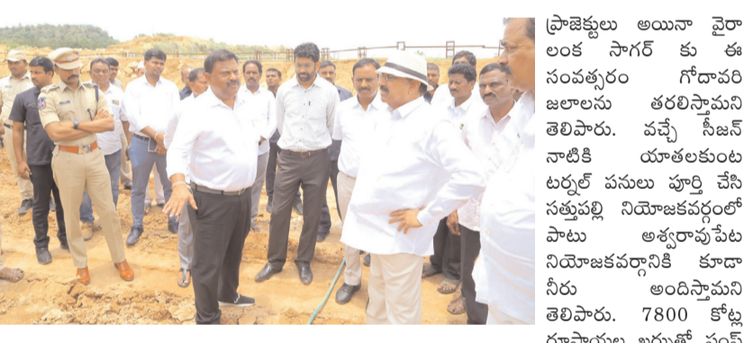
ప్రాజెక్టులు అయినా వైరాలంక సాగర్ కు ఈ సంవత్సరం గోదావరి జలాలను తరలిస్తామని తెలిపారు. వచ్చే సీజన్ నాటికి యాతలకుంటు బర్లల్ పనులు పూర్తి చేసి సత్తుపల్లి నియోజకవర్గంలో పాలు అశ్వరావుపేట నియోజకవర్గానికి కూడా నీరు అందిస్తామని తెలిపారు. 7800 కోట్ల రూపాయల ఖర్చుతో పంచ్