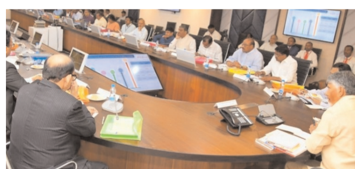
ఈ ఏడాది లక్ష్యం రూ.5.40 లక్షల కోట్లు 2024-25 ఆర్థిక సంవత్సరానికి రూ.5,40,000 కోట్లతో రుణ ప్రణాళిక విడుదలను విడుదల చేశారు. ఇందులో రూ.3,75,000 కోట్లు ప్రాధాన్య రంగాలకు, రూ.1,65,000 కోట్లు ఇతర రంగాలకు కేటాయింపారు. వ్యవసాయ రంగానికి రూ.2,64,000 కోట్లు రుణాలు లక్ష్యం కాగా, గతం కంటే 14 శాతం అధికంగా రుణాలు ఇవ్వాలని ఈ ప్రణాళికలో పేర్కొన్నారు. డెయిరీ , ఫ్లాట్లీ, ఫిషరీస్, వ్యవసాయ యంత్రీకరణకు, వ్యవసాయం రంగంలో మౌళిక సదుపాయాలకు రూ.32,600 కోట్లతో రుణ ప్రణాళికను సిద్ధం చేశారు. 2023-24 ఆర్థిక సంవత్సరానికి ప్రాధాన్యతా రంగానికి రూ.3,23,000 కోట్లు పెట్టుకోగా 9% ఈ ఆర్థిక సంవత్సరానికి రూ.3,75,000 కోట్లు రుణ లక్ష్యంగా పెట్టుకున్నారు. గతంలో బోర్నిట్ 16 శాతం అధికంగా రుణాల లక్ష్యం నిర్ణయించారు. వ్యవసాయ రంగానికి గత ఏడాది రూ.2,31,000

టి మీడియా, జూలై 9, విజయవాడ బ్యూరో : రుణ సాయంలో రైతులకు అత్యధిక ప్రాధాన్యం ఇవ్వాలని పవీ సీఎం చంద్రబాబు నాయుడు బ్యాంకర్లను కోరారు. సీఎం చంద్రబాబు నాయుడు అధ్యక్షతన సచివాలయంలో మంగళవారం 227వ ఎస్ ఎల్ బీ సీ సమావేశం జరిగింది. ఈ సందర్భంగా 2024-25 ఆర్థిక సంవత్సరానికి రుణ ప్రణాళికను రాష్ట్రస్థాయి బ్యాంకర్ల సమావేశం విడుదల చేసినది. ఈ సమావేశంలో ఆర్థిక శాఖ మంత్రి వయ్యాలపల శేఖర్, వ్యవసాయ శాఖామంత్రి కె.అచ్చెంనాయుడు, యూనియన్ కేంద్ర ఉద్దేశ్యాల డైరెక్టర్ సంజయ్ రుద్ర ఎస్ ఎల్ బీ సీ కన్వీనర్ సీఎస్ ఖాసరరావు తదితరులు పాల్గొన్నారు. ఈ సందర్భంగా బ్యాంకర్లు విడుదల చేసిన రుణ ప్రణాళిక వివరాలు ఇలా ఉన్నాయి. ప్రధానంగా రైతులు, కౌలు రైతులకు రుణ సాయం, ఉత్పత్తి పెరుగుదల, పేదరికం నిర్మూలన, ఉపాధి అవకాశాల కల్పన, సంపద సృష్టి అంతాపై బ్యాంకర్లతో సీఎం, మంత్రులు చర్చించారు.