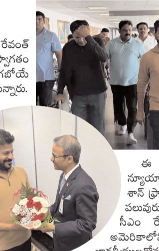
అమెరికాలోని ప్రవాస భారతీయులతో సమావేశమవుతారు.

● పలు కంపెనీలతో ఒప్పందాలు టీ మీడియా, ఆగస్టు 4, హైదరాబాద్: అమెరికాలోని న్యూయార్క్ లో సీఎం రేవంత్ బృందానికి ప్రవాస భారతీయులు ఘనస్వాగతం పలికారు. న్యూయార్క్ లో జరగబోయే కార్యక్రమంలో సీఎం రేవంత్ పాల్గొనబోతున్నారు. 11రోజుల పర్యటనలో భాగంగా అమెరికాలోని పలు నగరాలు సహా దక్షిణ కారియోలోని సియోల్ లోను సీఎం రేవంత్ రెడ్డి బృందం పర్యటించనుంది. ఆగస్టు 14 వరకు ఈ పర్యటన కొనసాగుతుంది. ఎనిమిది రోజులు అమెరికాలో, రెండు రోజులు దక్షిణ కారియోలోని సియోల్ లోను సీఎం రేవంత్ రెడ్డి బృందం పర్యటించనుంది. ఆగస్టు 14 వరకు ఈ పర్యటన కొనసాగుతుంది. ఎనిమిది రోజులు అమెరికాలో, రెండు రోజులు దక్షిణ కారియోలోని సియోల్ లోను సీఎం రేవంత్ రెడ్డి బృందం పర్యటించనుంది. ఆగస్టు 14 వరకు ఈ పర్యటన కొనసాగుతుంది. ఎనిమిది రోజులు అమెరికాలో, రెండు రోజులు దక్షిణ కారియోలోని సియోల్ లోను సీఎం రేవంత్ రెడ్డి బృందం పర్యటించనుంది.