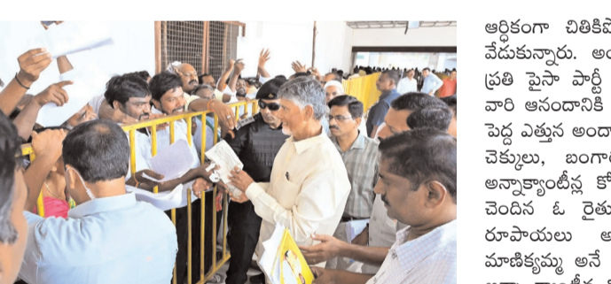
కార్యకర్తలు, అభిమానులు పెద్ద ఎత్తున చేరుకుని ఆయనకు గ్రాండ్ వెల్వెట్ చెప్పారు. ఇక మంగళగిరి పార్టీ ఆఫీసుకు చేరుకున్న ఆయన 90% దాదాపు మామ గంటలు నిల్చుని ప్రజా సమస్యలు తెలుసుకున్నారు. తనను కలవడానికి వచ్చిన ప్రతిఒక్కరితోనూ మాట్లాడారు. రాష్ట్ర నలుమూలల నుంచి వచ్చిన వారిని ఆహ్వానంగా పలకరించారు. వారి సాధకభాగ్యాలను సీఎం పంచుకున్నారు. వైసీపీ నేతల పై చంద్రబాబుకు పెద్ద ఎత్తున ఫిర్యాదులు అందాయి. భూ సమస్యలంటూ కొందరు, అక్రమ కేసులంటూ మరికొందరు చంద్రబాబును కలిసి వివరించారు. అందరూ సహాయంతో పాటు పెద్ద ఎత్తున ఫిర్యాదులను స్వీకరించారు.

● తరలివచ్చిన మహిళలు, దివ్యాంగులు టీ మీడియా, ఆగస్టు 4, మంగళగిరి: రాష్ట్ర పోస్టల్ సేవలలో సీఎం చంద్రబాబు ప్రజా ప్రతినిధులందరూ ప్రజల్లో ఉండాలని ప్రతి ఒక్కరికీ సీనియర్ గా చెప్పిన బాబు.. తానూ ఆ విషయాన్ని సీనియర్ గానే తీసుకున్నారు. అందిరిలా నేను, అందరితో నేను అన్నట్లు.. మంగళగిరిలో ఉన్న పార్టీ కేంద్ర కార్యాలయానికి చంద్రబాబు వెళ్లడంతో.. మంగళగిరి ఒక్కసారిగా మెరిసింది. పార్టీ నేతలకు పంపగల్గినట్లంది. సామాన్యులకు కొండంత అండ దొరికినట్లంది. ఏపీలో పోస్ట్ బ్యాంక్ అయిన చంద్రబాబు.. జెడ్ స్కీమ్ లో డూసుకెళ్తున్నారు. బ్రెండో ఫోటో అవడమూ తెలుసు.. సెట్ చేయడమూ తెలుసుంటూ ఫుల్ జోష్ లో ఉన్నారు. పొలంలో తనదైన చూట్ల చూపుతున్నారు. ప్రజల చేత ఎన్నకోబడతూ ప్రజా ప్రతినిధి ఛార్జితంగా ప్రజల్లో ఉండాలి. వారి సమస్యలను నేరుగా తెలుసుకోవాలని చెప్పిన బాబు.. తానూ ఆ విషయాన్ని తూచా తప్పకుండా పోలో అవుతున్నాను. సీఎం అయ్యాడే, ఫుల్ బిజీ పెద్దయ్యాడే ఉన్నప్పటికీ.. ప్రజల కోసం ఒక్కరోజు అంటూ ముందుకు కదలేదాటారు. మంగళగిరి కేంద్ర కార్యాలయంలో ప్రజలతో చంద్రబాబు మమేకమయ్యారు. సీఎం చంద్రబాబు మంగళగిరి ఎంటర్ అప్పుడనే ఘనస్వాగతం లభించింది. పార్టీ