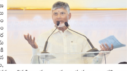
వారంతా భూములు ఇచ్చారని అన్నారు. అమరావతి కోసం 54 వేల ఎకరాలు సేకరించామన్నారు. మహిళా రైతులు వైసిపి ప్రభుత్వంపై గట్టిగా పోరాడారు అని అభినందించారు. రాష్ట్రానికి మధ్యలో ఉండే ప్రాంతం.. అమరావతి అని, ఒక రాష్ట్రం, ఒక రాజధాని అని.. ప్రతిచోటా చెప్పాను 90% అని గర్వం చేశారు. విశాఖను ఆర్థిక రాజధానిగా చేస్తాం అని చెప్పారు. కర్నూలులో హైకోర్టు బెంచ్, పరిశ్రమలను ఏర్పాటు చేస్తాం అని చంద్రబాబు వెల్లడించారు. అమరావతికి విట్, ఎస్ఆర్ఎం, అమృత్ పర్ణిటీలు పన్నులను తెలిపారు. దేశంలోని టాప్ 10 విద్యాసంస్థల బ్రాండ్లు ఇక్కడికి రావాలని కోరారు. బుల్డేజీ రైలు ఇన్ఫ్రాస్ట్రక్చర్ కేంద్రంగా నిర్వహించాలని వెల్లడించారు. హైదరాబాద్, బెంగళూరు, చెన్నై, అమరావతి మీదుగా బుల్డేజీ రైలు వాహనం చెప్పారు. అమరావతి నిర్మాణానికి రుణం ఇచ్చేందుకు ప్రపంచ బ్యాంకు అంగీకరించినది తెలిపారు. అమరావతిలో నిర్మాణ పనులు జెట్ స్పీడ్తో జరగాలి అని చంద్రబాబు అధికారులను ఆదేశించారు.

అమరావతిలో రాజధాని నిర్మాణ పనులను ముఖ్యమంత్రి చంద్రబాబు పున: ప్రారంభించారు. శనివారం ఉదయం తుళ్లూరు మండలం ఉద్గండరాయని పాఠశాల దగ్గర సీఆర్డీఏ అధీను వసులను ప్రారంభించి ఈ కార్యక్రమానికి శ్రీకారం చుట్టారు. సీఆర్డీఏ భవన ప్రాంగణంలో సిఎం చంద్రబాబు, మంత్రి నారాయణ పూజా కార్యక్రమం నిర్వహించారు. రూ. 160 కోట్లతో గతంలో డిడిపి హయాంలో ఏడంతస్తుల్లో సీఆర్డీఏ కార్యాలయ పనులు అవసరం. ప్రాజెక్టు కార్యాలయ నిర్మాణాన్ని 2017లో ప్రారంభించారు. వైసిపి ప్రభుత్వం అధికారంలోకి వచ్చాక ఈ పనులను ఆపేశారు. మొత్తం 3.62 ఎకరాల్లో టీ షర్ట్ 7 భవనాన్ని ఇక్కడ ప్రభుత్వం నిర్మిస్తోంది. అదనంగా పార్కింగ్, ల్యాండ్ స్టేసింగ్ కు 2.51 ఎకరాలు విస్తీర్ణం కేటాయించారు. ఆర్కిటెక్చర్ ఫినిషింగ్, ఇంటీరియర్స్, ఎలక్ట్రిక్ పనులు పెండింగ్లో ఉన్నాయి. ఈ సందర్భంగా ఏర్పాటు చేసిన కార్యక్రమంలో చంద్రబాబు మాట్లాడుతూ, చరిత్రను తిరగరాసేందుకు అంతా ఇక్కడ సమావేశమయ్యామన్నారు. రాష్ట్ర విభజన సమయంలో అనేక ఇబ్బందులు వచ్చాయని తెలిపారు. ఉమ్మడి ఆంధ్రప్రదేశ్ లో