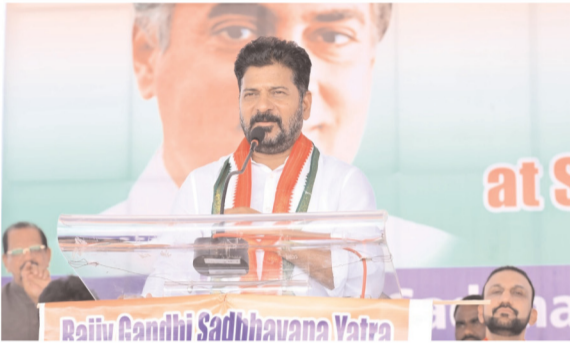
ప్రభుత్వ భూముల ఆక్రమణలను నిరోధించడం వంటి ఎన్నో ప్రజాసౌలభ్యాల కోసం హైద్రా పనిచేస్తుంది. చెరువులు, కుంటలు, నాలాలు, ప్రభుత్వ భూములను ఆక్రమించుకున్న వారు, 111 జీహెచ్ ఉల్లంఘించిన వారు మాత్రమే హైద్రాను చూసి భయపడుతున్నారు. మరీపుటేమగులను అణచడానికి అంకుశం తరచాలే

టి మీడియా, అక్టోబర్ 19, హైదరాబాద్ లిక్కర్ : ములికికూపంలో మగ్గుతున్న నిరుపేదలకు మంచి భవిష్యత్తును అందించాలన్న లక్ష్యంతోనే మూసీ పునరుజ్జీవ ప్రాజెక్టు చేపట్టామని ముఖ్యమంత్రి రేవంత్ రెడ్డి గారు మరోసారి స్పష్టం చేశారు. మూసీ పునరుజ్జీవం కోసం చేపట్టిన ప్రాజెక్టు, జీహెచ్ఎస్ పరిధిలో చేపట్టిన హైద్రా వ్యవస్థ రెండు వేర్వేరు విధముల చెప్పాలి. మాజీ ప్రధానమంత్రి రాజీవ్ గాంధీ సద్భావనా యాత్ర సందర్భంగా కమిటీ చార్మినార్ వద్ద నిర్వహించిన కార్యక్రమంలో సీఎంగా పాల్గొన్నారు. ఈ సందర్భంగా స్వర్ణీయ రాజీవ్ గాంధీ చిత్రపటానికి పుష్పాంజలి ఘటించారు. రాజీవ్ గాంధీ సద్భావన అవార్డును మాజీ మంత్రి గీతారెడ్డి గారికి ముఖ్యమంత్రి గారి చేతుల మీదుగా బహూకరించారు. ఈ సందర్భంగా సీఎంగా మాట్లాడుతూ... దేశ సమగ్రతను కాపడటానికి చేపట్టిన రాజీవ్ గాంధీ సద్భావనా యాత్రను స్ఫూర్తిగా తీసుకుని మత సామరస్యాన్ని కాపాడుకుంటూ తెలంగాణ అభివృద్ధికి ముందుకు సాగుతాం. ట్రాఫిక్ నియంత్రణ, అండర్ గ్రౌండ్ డ్రైనేజీలు, నాలాలో పేరుకుపోయిన చెత్తను తొలగించడం, కలషిటాలను నిలుపుడం చేయడం,