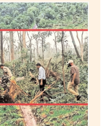
మెదులుతున్న ఉంటుంది. జోన్-5లో నేపాల్, భూటాన్, చైనా(టిబెట్ ప్రాంతం), పాకిస్తాన్ - మగతా 3లో..