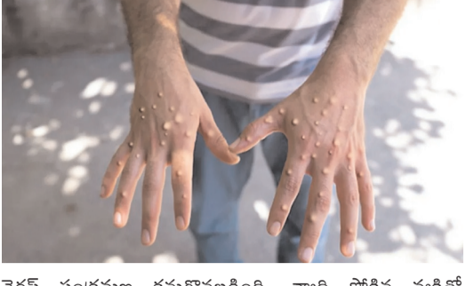
Image గురుకులులో చదివి.. ఫైలట్ శిక్షణకు ఎంపికైన కరీంనగర్ కుర్రోడు లక్షణాలు ఎంపాక్స్ ప్రారంభ లక్షణాలు జ్వరం, తీవ్రమైన తలనొప్పి, వెన్నునొప్పి, కండరాల నొప్పి, శక్తి లోకపోవడం. జ్వరం వచ్చిన 13 రోజులకే శరీరంపై మళుచిని పోలిన పొక్కులు రావడం ప్రారంభమవుతుంది. ముఖం, చేతులపై బొట్టలు ఎక్కువగా కనిపిస్తాయి. అవి అరచేతులు, జననేంద్రియాలు, కండక్టలు, కార్నియాపై కూడా కనిపిస్తాయి. ఎంపాక్స్ ఇంకొక మేషన్ పీరియడ్ ఆరు నుండి 13 రోజులు. కొన్ని సందర్భాల్లో ఇది ఐదు నుండి 21 రోజుల వరకు ఉంటుంది. ఎంపాక్స్ లక్షణాలు రెండు నుంచి నాలుగు వారాల వరకు ఉంటాయి. కానీ ఈ వ్యాధికి మరణాల రేటు సాధారణంగా తక్కువగా ఉంటుంది.

టీ మీడియా, డిసెంబర్ 16, కర్నూలు : దేశంలో మళ్లీ మంకీపాక్స్ వ్యాధి నిర్ధారణ అయింది. అబిదాబి నుంచి వచ్చిన వారు నాన్-పాత్రికీయంగా చేరిన వ్యక్తికి ఈ వ్యాధి ఉన్నట్లు నిర్ధారణ అయింది. వెంటనే అతన్ని పరియోజన మెడికల్ కాలేజీలో చేర్చారు. ఇదిలా ఉండగా తాజాగా మరో వ్యక్తికి మంకీపాక్స్ నిర్ధారణ అయింది. దుబాయి నుంచి వచ్చిన మరో వ్యక్తిలో కూడా అదే లక్షణాలు కనిపించాయి. అతని రక్త నమూనాను పరీక్షల నిమిత్తం ల్యాబ్ కు తరలించారు.