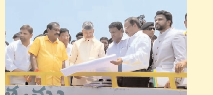
పోలవరం ప్రాజెక్టును సందర్శించిన చంద్రబాబు టి మీడియా, డిసెంబర్ 16, పోలవరం:

ఏసీ సీఎం చంద్రబాబు పోలవరం ప్రాజెక్టును సందర్శించారు. ఏరియల్ వ్యూ ద్వారా పోలవరం ప్రాజెక్టు పరిశీలించారు. పోల్ వ్యూ పాయింట్ నుంచి కూడా పోలవరం ద్వారా సుపరిశీలించారు. గ్యాస్-1, గ్యాస్-2 పనులతో పాటు డయాఫ్రం వాల్ నిర్మాణ పనులను కూడా చంద్రబాబు పరిశీలించారు. తన పర్యటన సందర్భంగా ప్రాజెక్టు వద్ద ఏర్పాటు చేసిన ఫోటో ఎగ్జిబిషన్ ను తిలకించారు. ఇక్కడ, పనులు జరుగుతున్న తీరుపై అధికారులను అడిగి వివరాలు తెలుసుకున్నారు. అధికారులు, పోలవరం ప్రాజెక్టు ఇంజనీర్లతో చంద్రబాబు సమీక్ష నిర్వహించారు. పోలవరం ప్రాజెక్టు రాష్ట్ర ప్రభుత్వానికి ఎంతటి ప్రాధాన్యతా అంశమో వారికి వివరించారు. పోలవరం ప్రాజెక్టు భవిష్యత్ నిర్మాణాల షెడ్యూల్ ను చంద్రబాబు విడుదల చేయనున్నారు.