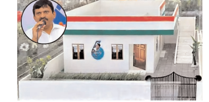
పొందుపర్చామని, ప్రస్తుతం వాటిని మాత్రమే సర్వే చేస్తున్నామని నిబ్బంది సమాధానం ఇస్తున్నారు. ఇప్పటికిప్పుడు అంటే ఎలా దంపతులిద్దరు జిల్లా కేంద్రంలో అర్జీలతో ఉంటూ విన్నవలు చేసుకొని జీవనం సాగిస్తున్నారు. వీరు ప్రజాపాలనలో ఇంటి కోసం దరఖాస్తు చేసుకున్నారు. వీరికి సొంతంగా ఖాళీ స్థలం ఉందని వివరాలు తెలిసాయి. కానీ సర్వే సందర్భంలో స్థలం దస్తావేజులు అందుతున్నాయి. పుట్టింటివారు ఉన్న దాంట్లో ఒక్కొక్కరికూ ఉన్న వంద, నూటయొక్క చదరపు గజాలు వసూలు కుంకుము కింద ఇస్తారు, వీటికి పత్రాలు రాసుకోరు అని సర్వేయర్లకు చెప్పగా, వారు పెద్దమనుషుల సమక్షంలో రాసుకున్నా. ఇప్పటికిప్పుడు రాయించుకుని అంటున్నారు. ఇప్పటికిప్పుడు రాయించుకుని రావడం అంటే ఇబ్బందేనని అర్జీదారులు వాపోతున్నారు. సర్వే ప్రక్రియకు అటంకంగా మారటంతో నిబ్బంది స్థలం లేదని వివరాలు సమాధానం చేస్తున్నట్లుగా ఫిర్యాదులందుతున్నాయి. ప్రజలకు ఎలా తెలిసింది నిజమాబాద్ లో ఉంటూ ప్రైవేటు ఉద్యోగం చేసుకుంటున్న కుటుంబానికి కామరాట్ జిల్లాలో స్థలం ఉంది. వీరు ప్రజాపాలన దరఖాస్తు నిజమాబాద్ లోని అర్జీల వివరాలు యావోలో

టీ మీడియా, డిసెంబర్ 29, హైదరాబాద్ బ్యూరో: సర్వే వేళ వెల్లువెత్తుతున్న ప్రశ్నలు - సమాధానం చెప్పలేక సతమతమవుతున్న సర్వేయర్లు - మరి సమస్యలు : ఇందిరమ్మ ఇళ్ల పథకం దరఖాస్తుల సర్వే కొనసాగుతోంది. ప్రజాపాలన గ్రామ సభల సందర్భంలో సంక్షేమ పథకాల లబ్ధి కోసం అర్జీలను స్వీకరించిన విషయం తెలిసిందే. ఇందులోనే సొంత స్థలం ఉంది ఇల్లు నిర్మించుకుంటే రూ.5 లక్షల ఆర్థికసాయం, స్థలం లేని వారికి ఇంటి స్థలంకోసం పాటు నిర్మించి ఇచ్చే పథకం ఉన్నాయి. దీన్ని ఎంచుకున్న వారి వివరాలను ఇటీవల అందుబాటులోకి తెచ్చిన ఇందిరమ్మ ఇళ్ల పథకం యావోలో సమాధానం చేస్తున్నారు. ఆ డేటా చేస్తూ వివరాలను పరిశీలిస్తే, అర్జీదారు, స్థలం, దస్తావేజులు, ఫోటోలు తీసి యావోలో సమాధానం చేస్తున్నారు. ఈ క్రమంలోనే ప్రజల నుంచి వలు సందేహాలు, ప్రశ్నలు ఎదురవుతున్నాయి. వాటిని నివృత్తి చేయటంలో నిబ్బంది వివరమవుతున్నారు. అడిగిన ప్రశ్నలకు ఏం సమాధానం చెప్పాలో తెలియక సతమతమవుతున్నారు. ప్రజాపాలన సభల్లో దరఖాస్తులు స్వీకరించి దాదాపు సంవత్సరం కావ్వడం. అప్పట్లో తెల్లరేపన్ కార్డు ఉన్నవారికి పథకాలు అందడం కొందరు సొంతంగా ఖాళీ స్థలం ఉన్నా అంటే పథకానికి అర్హులు చేయలేదు. అప్పుడేమో రేపన్ కార్డు లేకున్నా ప్రభుత్వ పథకాలకు అర్హులే అంటున్నారు. కానీ ఇప్పుడు దరఖాస్తు చేద్దామంటే వీలు కాదంటున్నారు. గతంలో పెట్టుకున్న ఆర్డీల వివరాలు యావోలో