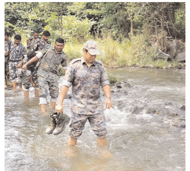
కంపెనీ వారికి ఈ సందర్భంగా ప్రత్యేక ధన్యవాదములు తెలిపారు.

తెలిపారు. వరద ప్రభావిత ప్రాంతాల్లో నివసించే ఆదివాసీ ప్రజలు అప్రమత్తంగా ఉండాలని సూచించారు. వర్షాల అనంతరం పరిసర ప్రాంతాలను పరిశుభ్రంగా ఉంచుకోవాలని అన్నారు. డెంగీ, మలేరియా వంటి విషజ్వరాల బారిన పడకుండా ముందస్తు జాగ్రత్తలు తీసుకోవాలని అన్నారు. అభివృద్ధి నిరోధకులైన నిషేధిత మావోయిస్టులకు ఎవ్వరూ సహకరించవద్దని కోరారు. ప్రత్యక్షంగానైనా, పరోక్షంగానైనా మావోయిస్టులకు సహకరిస్తే, అట్టి వారిపై చట్టపరంగా కఠిన చర్యలు తీసుకొనబడతాయని అన్నారు. మారుమూల ఏజెన్సీ ప్రజలకు నిత్యావసర వస్తువులను అందించడానికి ముందుకొచ్చిన Nestle