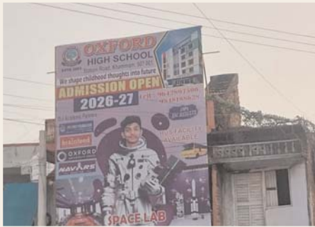
నగరం నలువైపులా అనధికార హోర్డింగ్స్