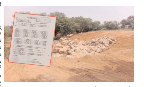
ఫిర్యాదులు అందుకోవడంతో సరి..