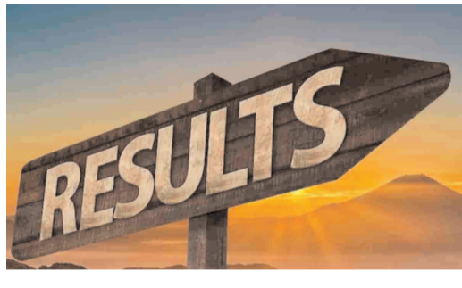
ఫలితాల్లో బాలికలదే పైచేయి

టీ మీడియా, ఏప్రిల్ 30, అమరావతి : ఏపీలో 2026 విద్యా సంవత్సరానికి సంబంధించి పదో తరగతి ఫలితాలు వెలువడ్డాయి. ఫలితాలను విద్యార్థులు మంత్రి లోకేశ్ విడుదల చేశారు. పదో తరగతి ఫలితాల్లో ఉత్తీర్ణత శాతం 85.25గా నమోదైంది. పదో తరగతి ఫలితాల్లో గతేడాది 81.14 ఉత్తీర్ణత శాతం నమోదు కాగా ఈ ఏడాది ఉత్తీర్ణత మరింత మెరుగైంది.