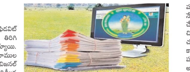
తిరస్కరించిన దరఖాస్తులను కూడా మళ్లీ పరిగణనలోకి తీసుకోవాలన్న విజ్ఞప్తులు జిల్లా కలెక్టర్లకు వస్తున్నాయి.

తెలంగాణలో భూ క్రయవిక్రయదారులు ఇద్దరు అఫిడవిట్ సమర్పించాలన్న నిబంధనను సవరించడంతో తిరిగి సాదాబైనామా పరిష్కారాలు తాజాగా ప్రారంభం అయ్యాయి. రాష్ట్రవ్యాప్తంగా లక్షల సంఖ్యలో రైతులు తమ భూముల క్రయబద్ధీకరణ కోసం ఎదురుచూస్తున్నారు. రెవెన్యూ డివిజన్ లో అఫిడవిట్ విచారణాధికారిగా సాదాబైనామా దరఖాస్తుల పరిశీలన కొనసాగుతోంది. 2020 అక్టోబరు-నవంబరులో రాష్ట్ర వ్యాప్తంగా సుమారు 9 లక్షల మంది రైతుల నుంచి సాదాబైనామా సమస్యపై దరఖాస్తులు ప్రభుత్వానికి అందాయి.