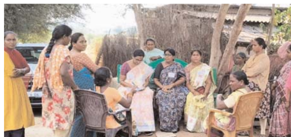
విచారణ పేరుతో కాలయాపన సరికాదు