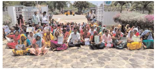
పేమెంట్ కోసం పట్టు విడవని 'పట్టు' కార్మికులు