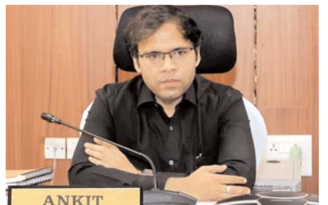
వైద్య ఆరోగ్య, మహిళా శిశు సంక్షేమ శాఖల ఆధ్వర్యంలో ఆరోగ్య శిబిరాలు నిర్వహించి గర్భిణులు, చిన్నారులకు వైద్య పరీక్షలు చేయాలని సూచించారు. విద్యాశాఖ

వివరాలను గ్రామ, వార్డు స్థాయిలో ప్రజలకు విస్తృతంగా తెలియజేయాలని అధికారులకు సూచించారు. ఇందుకోసం ప్రతి శాఖ తమకు సంబంధించిన పథకాలపై సమగ్ర నివేదికలు సిద్ధం చేసి ప్రజలకు వివరించాలని చెప్పారు. సభలు ఉదయం 9 గంటలకు ప్రారంభమయ్యేలా చర్యలు తీసుకోవాలని, ప్రజలకు సౌకర్యవంతంగా ఉండేలా షామియానాలు ఏర్పాటు చేయాలని ఆదేశించారు. అలాగే