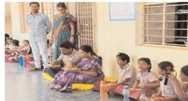
డీకాఓ నాగమణి మాట్లాడుతూ, పాఠశాలలో మధ్యాహ్న భోజనం మెనూ ప్రకారం అందుతున్నదని సంతృప్తి వ్యక్తం చేశారు. విద్యార్థులకు ప్రతిరోజూ నాణ్యమైన భోజనం అందించాలని నిర్వాహకులకు సూచించారు. అనంతరం

● విద్యార్థులు నేలపై... అధికారి ప్రత్యేక పట్టాపై భోజనం ● ప్రక్కనే చెప్పులతో నిలిచిన సిబ్బంది టీ మీడియా, ఏప్రిల్ 1, పాల్వంచ: జిల్లా స్థాయి అధికారిణిగా పేరున్న డీకాఓ, నాగమణి బుధవారం పాల్వంచ పట్టణంలోని వికలాంగుల కాలనీలో గల ప్రాథమికోన్నత పాఠశాలను ఆకస్మికంగా తనిఖీ చేశారు. విద్యార్థులతో కలిసి మధ్యాహ్న భోజనం చేసినప్పటికీ, ఆమె ప్రత్యేకంగా ఫ్లాస్టిక్ పట్టాపై కూర్చొని భోజనం చేయడం చర్చనీయాంశంగా మారింది. ఇదే సమయంలో, విద్యార్థులు నేలపై కూర్చొని భోజనం చేస్తుండగా, వారి మధ్యనే ఒక ఉపాధ్యాయుడు, మరొక సిబ్బంది చెప్పులు వేసుకుని డీకాఓకు సహాయకులుగా నిలబడటం విమర్శలకు దారి తీసింది. విద్యార్థుల వైపు ఎవరూ ప్రత్యేకంగా దృష్టి పెట్టకపోవడం కూడా స్థానికంగా చర్చకు కారణమైంది.