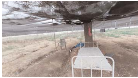
అస్సైట్ భూమి లో పాలి హాస్, బెడ్

-రూ. 80 కోట్ల విలువైన ప్రభుత్వ భూమి ప్రైవేట్ కి మార్పు