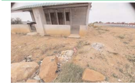
ప్రైవే వెంబడి ధరిణి దండాల కోసం షెడ్ (ఫైల్)