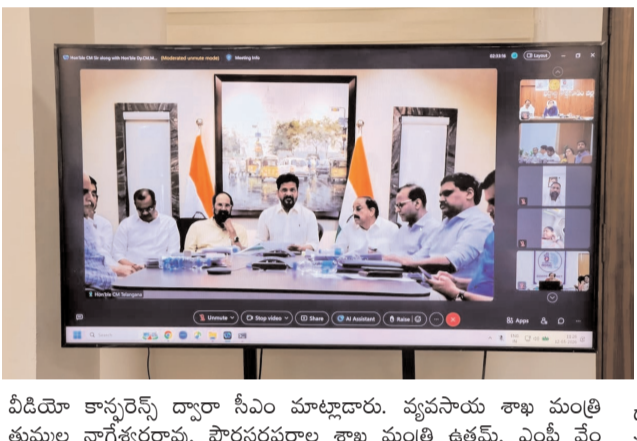
వీడియో కాన్ఫరెన్స్ ద్వారా సీఎం రేవంత్ రెడ్డి ధాన్యం సేకరణలో జాప్యం చేసిన కలెక్టర్లపై చర్యలు తీసుకోవాలని ఆదేశించారు.

• సీఎం రేవంత్ రెడ్డి సమీక్ష సమావేశం • ధాన్యం సేకరణ జరుగుతున్న తీరుపై ఆరా టీ మీడియా, మే 12, హైదరాబాద్ బ్యూరో : రాష్ట్రంలో ధాన్యం సేకరణ, మొక్కజొన్న కొనుగోళ్ల విషయంలో నిర్లక్ష్యాన్ని సహించేది లేదని ముఖ్యమంత్రి రేవంత్ రెడ్డి హెచ్చరించారు. కొనుగోలు కేంద్రాల్లో రైతులకు ఎలాంటి ఇబ్బందులు కలగకుండా చూడాలని, జిల్లా కలెక్టర్లు సంబంధిత అధికారుల క్షేత్రస్థాయికి వెళ్లి కొనుగోళ్ల తీరును పరిశీలించాలని ఆదేశించారు. గన్సి బ్యాగులు, హమాల్ కారిత లేకుండా చూసుకోవాలని, కొనుగోలు చేసిన ధాన్యాన్ని ఎప్పటికప్పుడు గోడౌన్స్ కు తరలించాలన్నారు. ధాన్యం సేకరణలో జాప్యం రాష్ట్రంలో ధాన్యం, మొక్కజొన్న కొనుగోళ్లపై సీఎం రేవంత్ రెడ్డి తన నివాసంలో సమీక్ష సమావేశం నిర్వహించారు. అన్ని జిల్లాల కలెక్టర్లతో