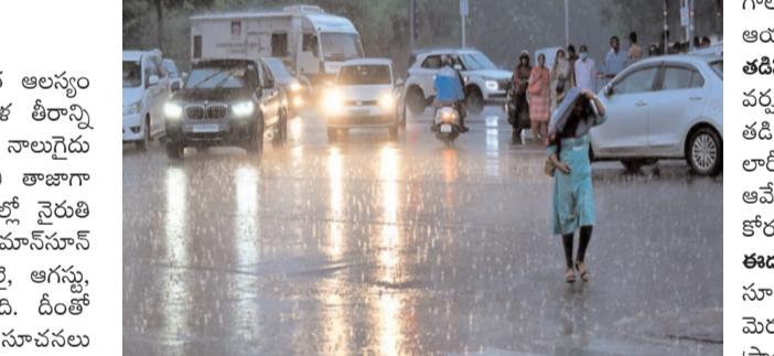
విద్యుత్ సరఫరాకు అంతరాయం మెదక్? జిల్లాలోని అనేక ప్రాంతాల్లో భారీ వర్షాలు కురిశాయి. వర్షం కారణంగా జిల్లా కేంద్రంలోని గంగిని థియేటర్ సమీపంలో రోడ్ బలమయ్యింది. దీంతో ఆ ప్రాంతంలో ట్రాఫిక్ కు తీవ్ర అంతరాయం కలిగింది. జిల్లాలోని ర్యాలీ మడుగు గ్రామంలో వర్షం కారణంగా ఓ విద్యుత్ ట్రాన్స్ ఫార్మర్ నెలకొరిగింది. ఇదే తరహాలో మంజోజిపల్లె గ్రామంలో కురిసిన భారీ వర్షంతో పాటు ఈదురు

● హైదరాబాద్ లోని పలు ప్రాంతాల్లో వర్షం టీ మీడియా, మే 25, హైదరాబాద్ బ్యూరో : రాష్ట్రానికి నైరుతి రుతుపవనాల ఆగమనం మరింత ఆలస్యం కానుంది. రుతుపవనాలు తొలక తనెల 26న కేరళ తీరాన్ని తాకుతాయని వాతావరణ శాఖ అంచనా వేసింది. అయితే నాలుగైదు రోజులు ఆలస్యంగా తీరాన్ని తాకే అవకాశం ఉందని తాజాగా తెలిపారు. తెలంగాణలోకి జూన్ 5 నుంచి 10 తేదీల్లో నైరుతి ప్రవేశించే అవకాశం ఉందని చెప్పింది. ఈ ఏడాది మ్యాన్ సూన్ సీజన్ పై ఎల్సినో ప్రభావం పడనుంధని.. జూన్, జులై, ఆగస్టు, సెప్టెంబర్లో దీని ప్రభావం చూపనుంధని వెల్లడించింది. దీంతో తెలంగాణలో లోటు వర్షపాతం సమాధియ్యే సూచనలు కనిపిస్తున్నాయి. ఉరుములు, మెరుపులతో కూడిన వానలు రాష్ట్రవ్యాప్తంగా ఇవాళ అనేక ప్రాంతాల్లో వర్షాలు కురిశాయి. హైదరాబాద్ లోని పలు ప్రాంతాల్లో వర్షం కురిసింది. నగరంలోనే అనేక చోట్ల ఉరుములు, మెరుపులతో కూడిన వర్షం పడింది. హయాస్? నగర్, పెద్ద అంబెల్ పేట్లో భారీ వర్షం కురవగా.. టోటల్ వర్షం వడగాళ్ల వర్షం పడింది.