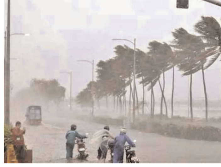
విద్యుత్ శాఖ మంత్రి గొట్టిపాటి రవికుమార్ తక్షణమే స్పందించి, క్షేత్రస్థాయి అధికారులతో ఫోన్లో మాట్లాడి వివరాలు ఆరా తీశారు. గాలుల తీవ్రతకు చెట్లు, డీసీషేడ్ చోర్లింగ్ల విరిగి విద్యుత్ స్తంభాలపై పడటంతోనే సరఫరా నిలిచిపోయిందని అధికారులు మంత్రికి వివరించారు. ఎప్పటికక్కడ లైన్లును క్షయించే పనులను వేగవంతం చేస్తున్నట్లు వివరించారు.

● అధికారులను అప్రమత్తం చేసిన మంత్రి గొట్టిపాటి టీ మీడియా, మే 25, బాపట్ల : ఎల్సినో ప్రభావంతో వాతావరణంలో మార్పులు జరుగుతున్నాయి. రాష్ట్రమంతా భానుడి భగభగలకు మండిపోతుంటే మరికొన్ని ప్రాంతాల్లో భారీ వర్షాలు కురుస్తున్నాయి. బాపట్ల జిల్లాలో తెల్లవారుజామున కురిసిన భారీ వర్షానికి కొన్ని ప్రాంతాల్లో భారీ వృక్షాలు నేలకొరిగాయి. భారీగా వర్షం కురవడంతో లోతట్ల ప్రాంతాలన్నీ జలమయమయ్యాయి. బాపట్ల జిల్లాలోని అమృతలూరులో ఆదివారం రాత్రి ఈదురు గాలులతో కూడిన ఆకాల వర్షం బీభత్సం సృష్టించింది. దాంతో గ్రామదేశవ ఆలయ ప్రాంగణంలోని వేపచెట్టు ఈదురు గాలులకు విరిగిపోయి విద్యుత్తు లైన్లు, తెనాలి చెరువుపల్లి ఆర్ఆం డి బీ రోడ్డుపై పడింది. మూడు స్తంభాలు నేలమట్టమయ్యాయి. విద్యుత్ తీగలు సైతం తెగిపోయాయి. అప్రమత్తమైన విద్యుత్ స్వచ్ఛంద ఫలితంగా విద్యుత్ సరఫరాకు తీవ్ర అంతరాయం ఏర్పడింది. చెట్లు, విద్యుత్తు స్తంభాలు రోడ్డుపై అడ్డంగా పడడంతో వాహనాల రాకపోకలు నిలిచిపోయాయి. గ్రామస్థులు వాహనాలను విద్యుత్తు శాఖ సిబ్బంది చేరే మార్గంలో మళ్లించారు. రహదారిపై అడ్డంగా పడిన విద్యుత్తు లైన్లు, స్తంభాలు, చెట్లను తొలగించే పనిలో నిమగ్నమయ్యారు. ఫలితంగా గ్రామంలో అందకారం నెలకొంది. పరిస్థితిని కలిగిన మంత్రి గొట్టిపాటి రాష్ట్రంలో కురిసిన భారీ వర్షం, ఈదురుగాలుల కారణంగా పలు ప్రాంతాల్లో విద్యుత్ సరఫరాకు అంతరాయం ఏర్పడిన పరిస్థితిపై