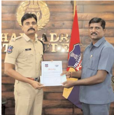
అందజేశారు. ఈ కార్యక్రమంలో ఆర్ ఐ ఆపరేషన్స్ రవి, టీం సిబ్బంది, తదితరులు పాల్గొన్నారు.

చేసుకొని మావోయిస్టులు ఏర్పాటు చేసినటువంటి 10 ఐజిడిలను కనుగొని వాటిని అత్యంత చాకచక్యంగా బీడి టీం సిబ్బంది నిర్మూలన చేసిందని అన్నారు. క్లిష్ట పరిస్థితులలో బీడి టీం ప్రదర్శించిన సమయస్ఫూర్తి, ధైర్యసాహసాలు ఎంతో గర్వకారణమని కొనియాడారు. సాంకేతిక పరిజ్ఞానాన్ని ఉపయోగించుకుంటూ అటవీ ప్రాంతాల్లో తనిఖీలు చేసేటప్పుడు నిర్ణీత నిబంధనలను కచ్చితంగా పాటించాలని, స్వీయ రక్షణకు అత్యంత ప్రాధాన్యత ఇవ్వాలని సూచనలు చేశారు. నూతన ఉత్సాహంతో పనిచేస్తూ ప్రతిభ కనబరిచిన 12 మంది బీడి టీం పోలీస్ సిబ్బందిని ఎస్పీ ప్రత్యేకంగా అభినందించి, ప్రశంసా పత్రాలు, రివార్డులను