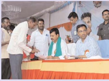
ప్రతి వినతికి న్యాయం చేస్తాం