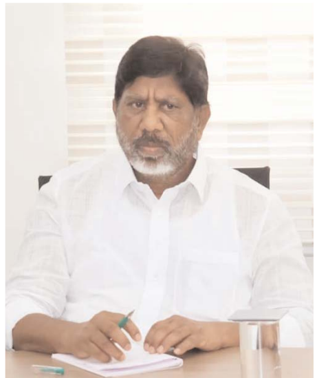
సూచించారు. అమ్మ ఆదర్శ పాఠశాల కమిటీల పనుల బిల్లులు అధికంగా క్లియర్ చేసినట్లు తెలిపారు.

తరలించవచ్చో ముందస్తు ప్రణాళిక సిద్ధం చేయాలని సూచించారు. ప్రాంతీయ సమన్వయకర్తలు వచ్చే 12 రోజుల్లో అన్ని పాఠశాలలను చెక్ లిస్ట్ ప్రకారం పరిశీలించి సమగ్ర నివేదిక సమర్పించాలని ఆదేశించారు. వచ్చే విద్యా సంవత్సరానికి పాఠ్యపుస్తకాలు, యూనిఫాం లు విద్యార్థులకు సకాలంలో అందించడాన్ని అత్యంత ప్రాధాన్యతగా తీసుకోవాలని పేర్కొన్నారు. విద్యపై ప్రభుత్వం అత్యంత ప్రాధాన్యత ఇస్తోందని, భారీగా నిధులు వెచ్చిస్తున్న నేపథ్యంలో నిర్లక్ష్యానికి తావులేదని స్పష్టం చేశారు. సిబ్బంది జీతాలు, డైట్ ఛార్జీలు, అద్దెల చెల్లింపులు ప్రభుత్వం క్రమం తప్పకుండా చెల్లిస్తున్నదని తెలిపారు. మరమ్మతుల నిధులు కూడా విడుదల చేస్తున్న నేపథ్యంలో పనులు క్షేత్రస్థాయిలో వేగంగా జరిగేలా అధికారులు సమన్వయంతో పనిచేయాలని