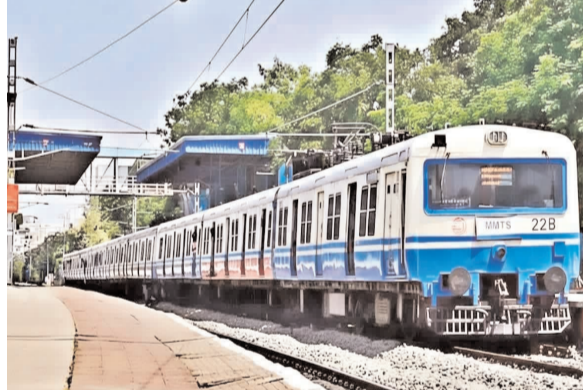
అంతేకాకుండా రాష్ట్ర ప్రభుత్వం ఎంఎంటీఎస్ ప్రాజెక్టు నిర్మాణానికి సంబంధించిన వాటా వివరాలను కూడా చెల్లించాలని రైల్వే బోర్డు సృష్టించింది. ఈ వాటా ఉన్నతాధికారులకు రైల్వేలో నుంచి లోబ రావడంతో మారు ముఖ్యులై రేవంత్ రెడ్డి దృష్టికి తీసుకెళ్లారు. కాగా, నగరంలో మెట్ల ప్రాజెక్టులు, హైస్కూల్ రైలు ప్రాజెక్టులకు సంబంధించిన అంశాలపై సీఎం డిల్లీ వెళ్లే ఆరోపనలో ఉన్నారు. ఇదే సందర్భంలో ఎంఎంటీఎస్ వ్యవహారం గురించి రైల్వే శాఖ మంత్రి వెన్నెకో? చర్చించాలని భావిస్తున్నట్లు

హైదరాబాద్ మహా నగర పరిధిలో ప్రయాణ సేవలందించే లోకల్ రైలు 'మట్టి మోడల్ ట్రాన్స్ పోర్ట్ సిస్టమ్'(ఎంఎంటీఎస్)లో ఉచిత ప్రయాణ సౌకర్యాన్ని కల్పించాలన్న రాష్ట్ర ప్రభుత్వ ప్రతిపాదనకు రైల్వే బోర్డు నిరాకారించింది. అంతేకాకుండా ఎంఎంటీఎస్ ఇప్పటికే తీవ్ర స్థాయిలో కొనసాగుతోందని, ఈ పథకాన్ని అమలు చేయలేమని బోర్డు తన అభిప్రాయం వ్యక్తం చేసింది. ఒకవేళ ఉచిత ప్రయాణ పథకాన్ని నిర్వహించాలంటే భవిష్యత్తులో ఆయో అదనపు ఖర్చులతో పాటు ఇదివరకు వస్తున్న ఆదాయం? స్థాయిలను కూడా రాష్ట్ర ప్రభుత్వమే భరించవలసి ఉంటుందని షరతు వేట్టింది. కాగా జూన్ 2 నుంచి ఈ పథకాన్ని అమలు చేయాలని ప్రభుత్వం భావించింది. రైల్వే మంత్రితో సంబంధం యాచన అంతేకాకుండా రాష్ట్ర ప్రభుత్వం ఎంఎంటీఎస్ ప్రాజెక్టు నిర్మాణానికి సంబంధించిన వాటా వివరాలను కూడా చెల్లించాలని రైల్వే బోర్డు సృష్టించింది. ఈ వాటా ఉన్నతాధికారులకు రైల్వేలో నుంచి లోబ రావడంతో మారు ముఖ్యులై రేవంత్ రెడ్డి దృష్టికి తీసుకెళ్లారు. కాగా, నగరంలో మెట్ల ప్రాజెక్టులు, హైస్కూల్ రైలు ప్రాజెక్టులకు సంబంధించిన అంశాలపై సీఎం డిల్లీ వెళ్లే ఆరోపనలో ఉన్నారు. ఇదే సందర్భంలో ఎంఎంటీఎస్ వ్యవహారం గురించి రైల్వే శాఖ మంత్రి వెన్నెకో? చర్చించాలని భావిస్తున్నట్లు