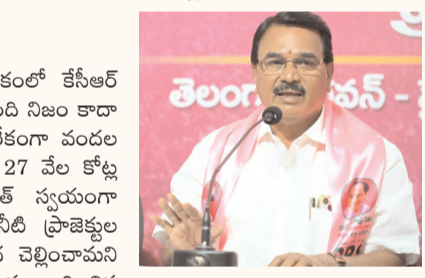
అంతేకాకుండా రాష్ట్ర ప్రభుత్వం ఎంఎంటీఎస్ ప్రాజెక్టు నిర్మాణానికి సంబంధించిన వాటా వివరాలను కూడా చెల్లించాలని రైల్వే బోర్డు సృష్టించింది. ఈ వాటా ఉన్నతాధికారులకు రైల్వేలో నుంచి లోబ రావడంతో మారు ముఖ్యులై రేవంత్ రెడ్డి దృష్టికి తీసుకెళ్లారు. కాగా, నగరంలో మెట్ల ప్రాజెక్టులు, హైస్కూల్ రైలు ప్రాజెక్టులకు సంబంధించిన అంశాలపై సీఎం డిల్లీ వెళ్లే ఆరోపనలో ఉన్నారు. ఇదే సందర్భంలో ఎంఎంటీఎస్ వ్యవహారం గురించి రైల్వే శాఖ మంత్రి వెన్నెకో? చర్చించాలని భావిస్తున్నట్లు