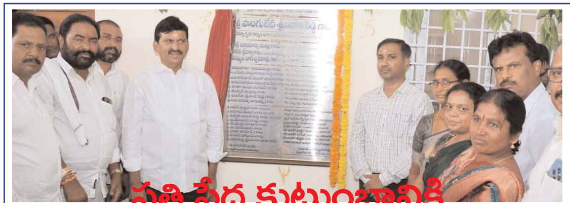
మంత్రి పేద కుటుంబానికి